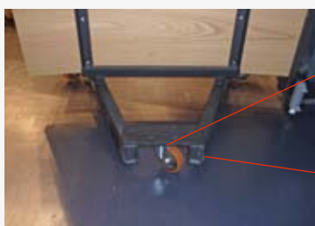
Bewegliches gelagertes Vulkollanrad Gegengewichte