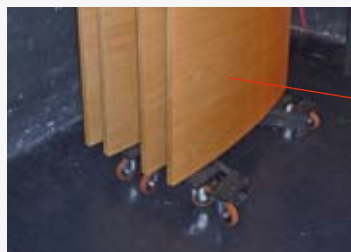
Einfache Staumöglichkeiten ohne Kippgefahr